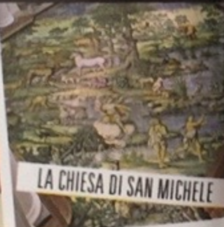
LA CHIESA DI SAN MICHELE