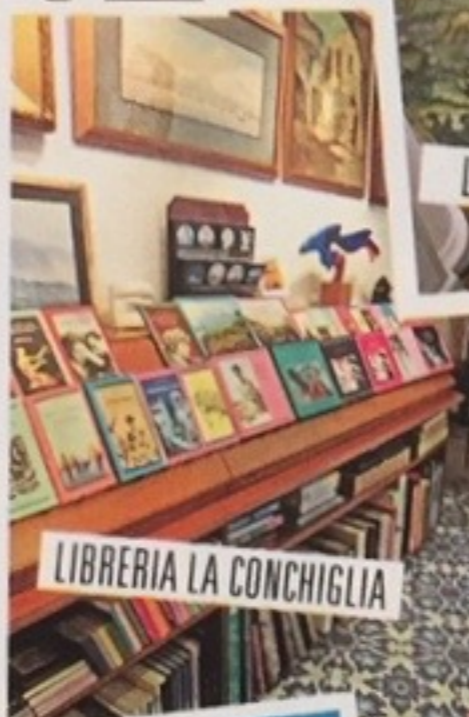
LIBRERIA LA CONCHIGLIA