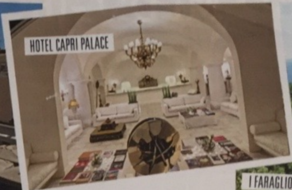
HOTEL CAPRI PALACE