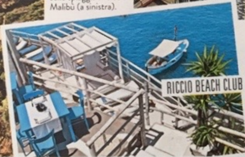
RICCIO BEACH CLUB