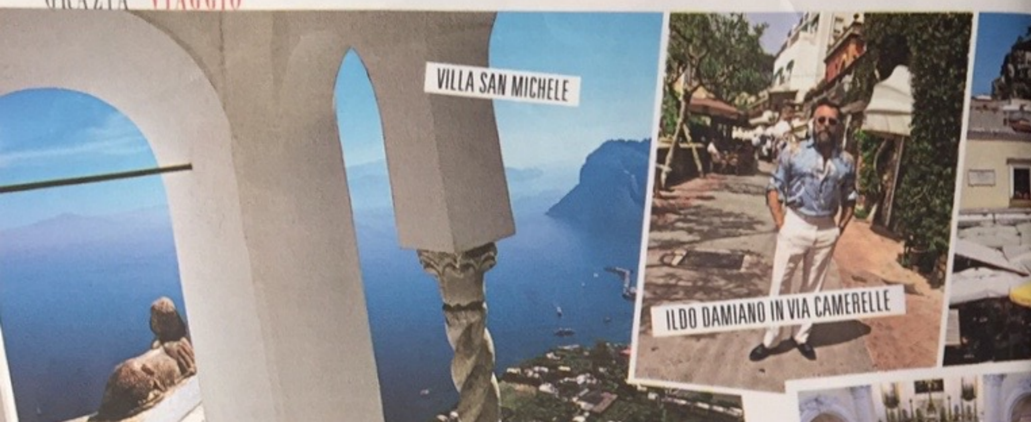
VILLA SAN MICHELE