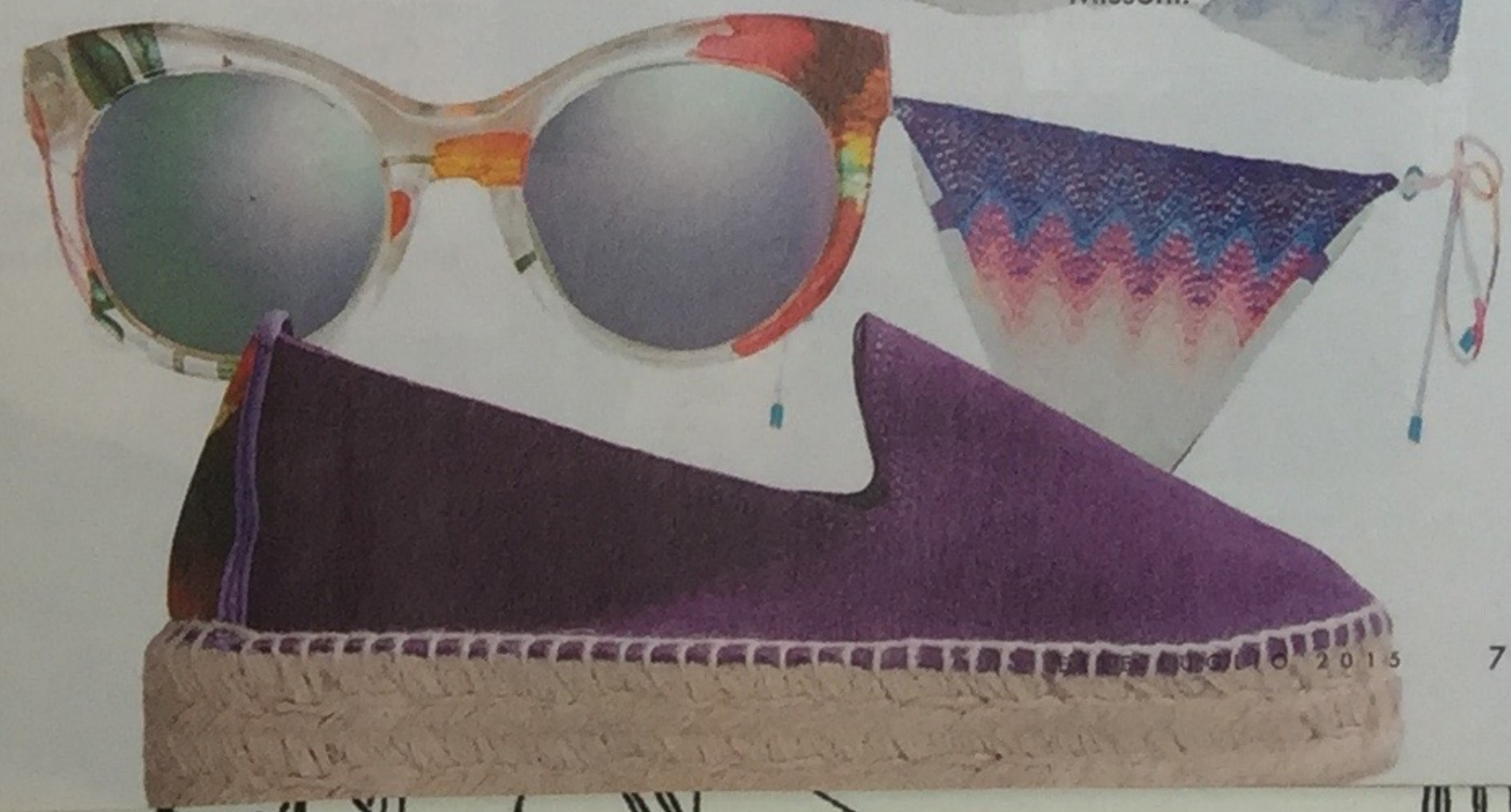
Bikini color mare, Missoni.

Da sinistra. Dedicata all'isola di Salina la borsa in toile de jouty e cuoio, Chez Dédé. Occhiali a specchio, Gucci. Espadrillas, Marta Ferri per Manebi, in vendita solo su thecorner.com.